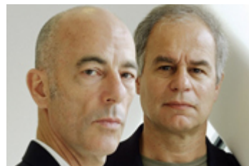
Los arquitectos Jacques Herzog y Pierre de Meuron, ganadores del concurso para diseñar la nueva sede de BBVA en Madrid

La nueva sede de BBVA actuará como una poderosa palanca para fomentar la Cultura de Empresa e impulsar las nuevas formas de trabajo, creando más espacios de interacción social, favoreciendo la comunicación y facilitando el trabajo en equipo persiguiendo un concepto innovador, que se adapte rápida y eficazmente a los cambios e incorpore el uso de las nuevas tecnologías.